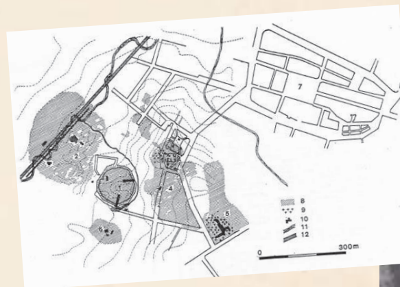
Moszczona drewnem ul. Szewska w Radomiu z okresu średniowiecza (Badania archeologiczne „Rewitalizacji” Spółki z o.o.).

Herby miejskie pojawiły się na ziemiach polskich pod koniec XIII w., wraz z kształtowaniem się sieci miast i upowszechnianiem prawa miejskiego wzorowanego na zasadach wypracowanych w Europie Zachodniej. Najczęściej był to przybrany znak pana zwierzchniego (władcy), wzbogacony o elementy przedstawiające architekturę miejską. Uznawano go za symboliczny znak władz miasta i autonomii gminy miejskiej, toteż był umieszczany przede wszystkim na pieczęciach miejskich (początkowo bez tarczy herbowej). Z czasem zaczął trafiać na fasady ratuszy, grafiki przedstawiające panoramy miast itp.