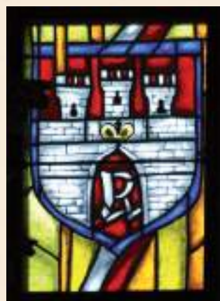
Witraż w kościele katedralnym w Radomiu z herbem miasta.