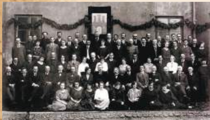
Członkowie zarządu miejskiego i pracownicy radomskiego magistratu, ok. 1925 r. Na ścianie budynku herb miasta z literą R w bramie z otwartymi odrzwiami. (Archiwum Państwowe w Radomiu)