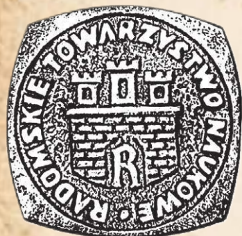
Medal Radomskiego Towarzystwa Naukowego