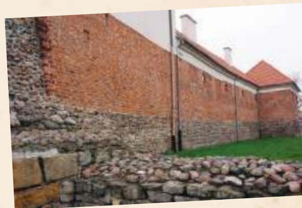
Mury miejskie Radomia wzniesione w drugiej połowie XIV w. Zachowany fragment od strony ul. Wałowej, obok relikwów Bramy Krakowskiej (Iłżeckiej).