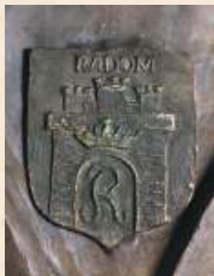
Herb Radomia na relikwiarzu św. Kazimierza Jagiellończyka w katedrze radomskiej.

Herb Radomia jest symbolem gminy miejskiej funkcjonującym na co dzień w przestrzeni miejskiej (budynki, tablice pamiątkowe, flagi, pamiątki turystyczne itp.), eksponowanym jednakże szczególnie przy okazji obchodów różnego rodzaju uroczystości lokalnych i ogólnopolskich. Wyjątkowy charakter ma umieszczenie go na relikwiarzu św. Kazimierza znajdującym się w kościele katedralnym, co jest symbolicznym zawierzeniem mieszkańców miasta jego patronowi. Był też wykorzystywany w urzędach w charakterze logo, a jego elementy jako znaku napieczony na pieczęciach Rady Miejskiej i Prezydenta Miasta. Uporządkowanie kwestii herbu Radomia i innych symboli (weksyliów, pieczęci, insygniów), wydaje się obecnie koniecznością. Dobrym przykładem jest tu uchwała radomskiej Rady Miejskiej z 27 stycznia 2020 r. o ustanowieniu hejnału, którym stał się utwór Alleluja Mikołaja z Radomia.