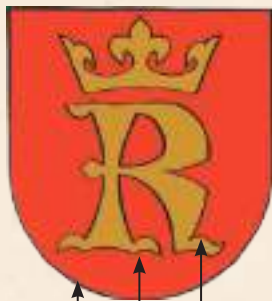
tarcza pole godło

W Polsce sprawy związane ze stanowieniem symboli jednostek samorządu terytorialnego reguluje ustawa z dnia 21 grudnia 1978 r. o odznakach i mundurach (Dz. U. z 2016 r., poz. 38), nad przestrzeganiem której czuwa powołana w 2000 r. Komisja Heraldyczna przy Ministerstwie Spraw Wewnętrznych i Administracji.