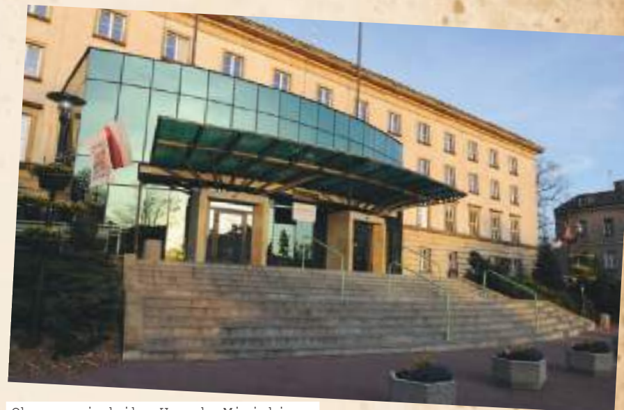
Obecna siedziba Urzędu Miejskiego od strony ul. Jana Kilińskiego – flaga z herbem Radomia w wersji uroczystej.