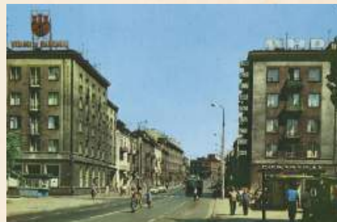
Herb miasta na budynku przy ul. Traugutta w Radomiu